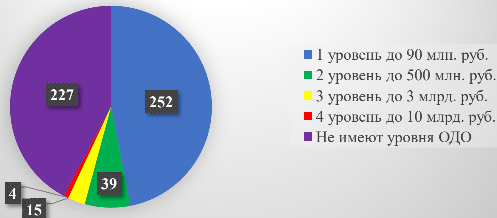
Распределение членов Ассоциации в зависимости от уровня ответственности по обеспечению договорных обязательств

В соответствии с наличием права осуществлять строительство, реконструкцию, капитальный ремонт, снос особо опасных, технически сложных и уникальных объектов капитального строительства распределение представляет следующий вид: